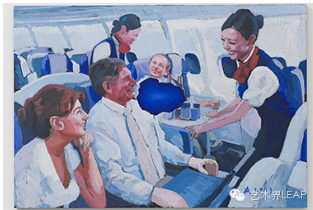
张慧，《蓝图·之前》，2013，布面丙烯，112 × 162厘米