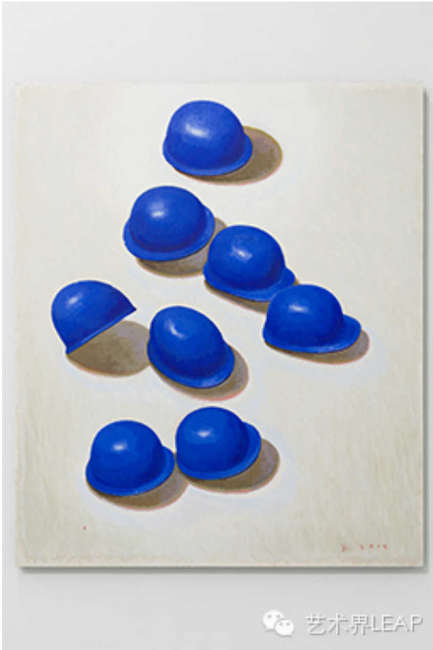
张慧，《蓝图. 聚集》，2014年，布面丙烯，190× 160 厘米