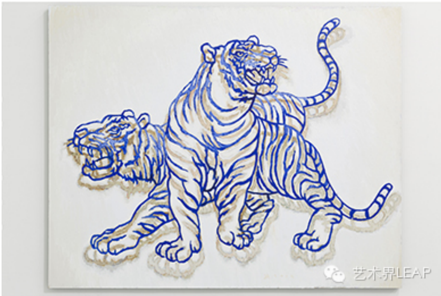
张慧，《蓝图. 交流 2》，2014年，布面丙烯，200 × 250 厘米

比起两年前的“空地”，此次长征空间的展览“广场”呈现出更明确的图像特征和更强烈的节奏感。在此前系统建立的基础上，张慧以更成熟清晰的方式继续着他所着迷的“视觉思维”与其生成图像之间的种种纠缠与游戏。然而，也正是在与自己的绘画越来越亲近的关系中，张慧警惕到惯性速度带来的危险性。比起之前的生涩质感所带来的张力，“广场”放大了某些当时已初露端倪的“亮点”，同时也让作品开始露在一种流畅关系所带来的光泽之中。这个展览事实上更接近创作的阶段性呈现，由此为更系统的展示与观看提供了具体的坐标。换句话说，张慧并不是那种让观众急于看到饱和结果的艺术家的，后者甚至在张慧的绘画面前与艺术家共同建立起一种对速效结果的审慎和对系统搭建的耐心。