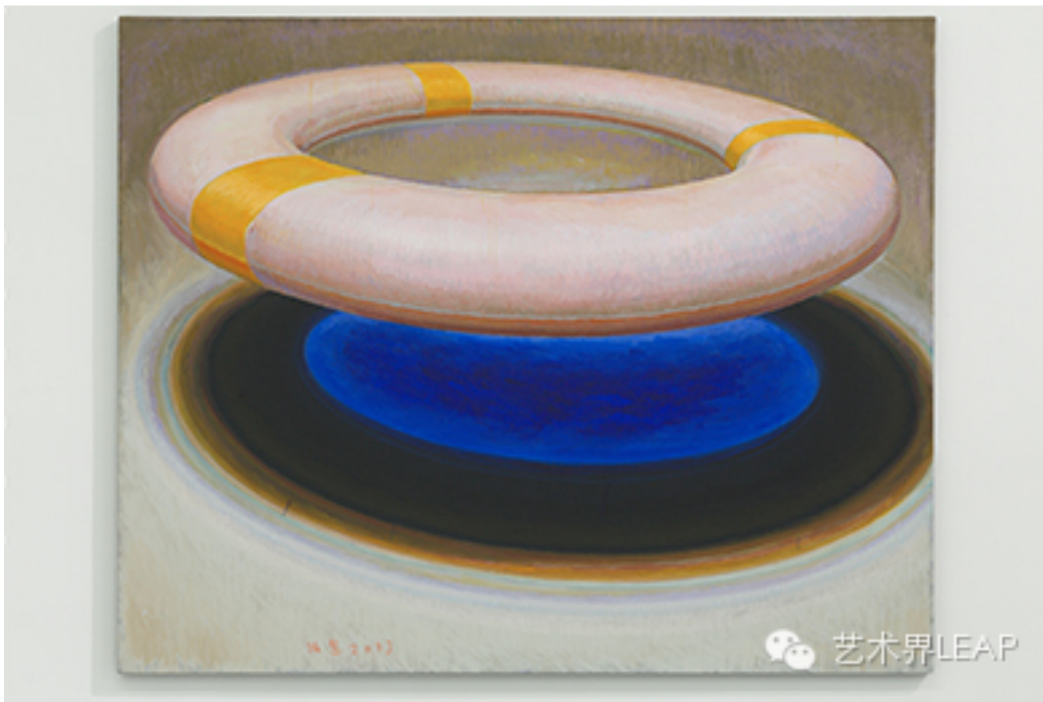
张慧，《蓝图. 色域》，2013年，布面丙烯，182× 225 厘米

言，“未知”并不指向模糊，他坦言要在创作中追求“是”而非“像”，二者间泾渭分明。一如戈达尔那句著名的言论，“这不是一个正确的图像，这只是一个图像”。